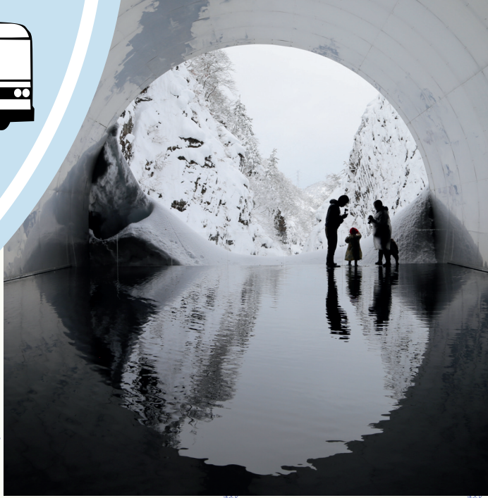
マ・ヤンソン/MADアーキテクト「Tunnel of Light」(大地の芸術祭作品)