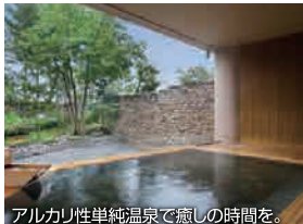
アルカリ性単純温泉で癒しの時間を。

プレー前後も 温泉、お食事、お土産、宿泊など、リゾートならではの至福のひとときを!!