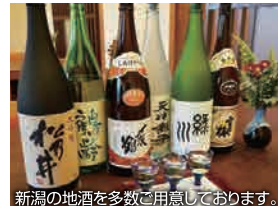
新潟の地酒を多数ご用意しております。