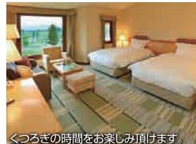
くつろぎの時間をお楽しみ頂けます。