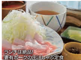
ランチは絶品! 妻有ポークの出汁じゃぶ定食