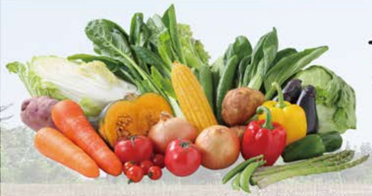
※野菜の写真はイメージです