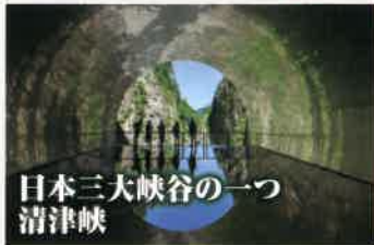
日本三大峡谷の一つ 清津峡