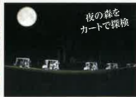
夜の森を カートで探検