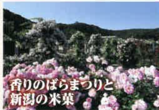
香りのばらまつりと 新潟の米菓