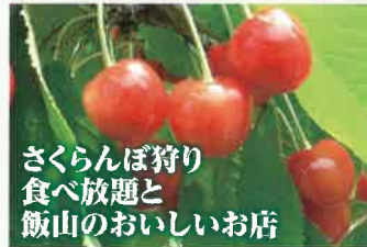
さくらんぼ狩り 食べ放題と 飯山のおいしいお店