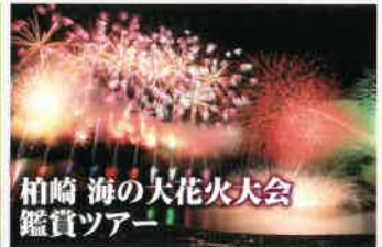
柏崎 海の大花火大会 鑑賞ツアー

※ツアーやプログラムは内容が変わる場合がございます。実施日はお問い合わせください。