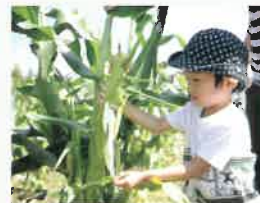
トモロコシ(8月中旬～)