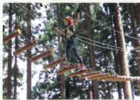
「アルプスアドベンチャー」

あてま 森と水辺の教室 ポポラ あてま高原の自然の中で、 自然環境のしくみを 楽しみながら勉強しよう!