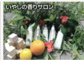
いやしの香りサロン