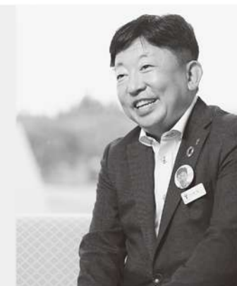
株当間高原リゾート ベルナティオ 上席執行役員 統括総支配人 兼 事業統括室室長

もちろん夢物語であるかもしれませんが、何も影響しないとは考えにくいのです。逆説的に考えると、現代の業界が抱える高い離職率は、数字の議論に終始しすぎた「生産性向上」の掛け声が、作り上げてきた副作用ではないのでしょうか？