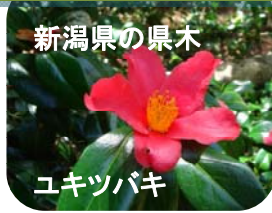
新潟県の県木 ユキツバキ