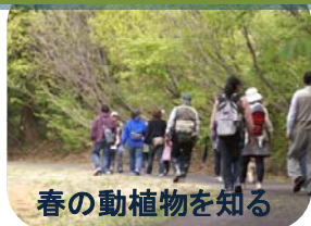
春の動植物を知る